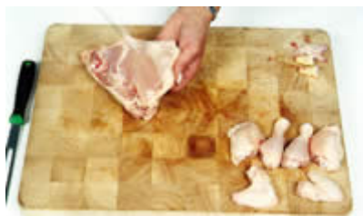
Fase 10: togliamo la pelle dal petto