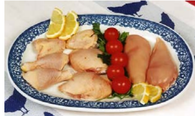
Abbiamo così ottenuto le parti del Galletto, pronte per la cottura.