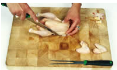
Fase 7: Separiamo le cosce...