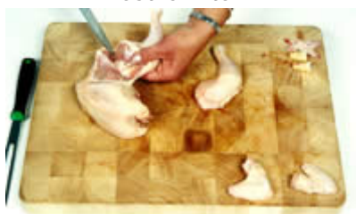
Fase 8: ...seguendo lo snodo