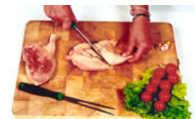
Fase 4: Il Galletto tagliato in quattro