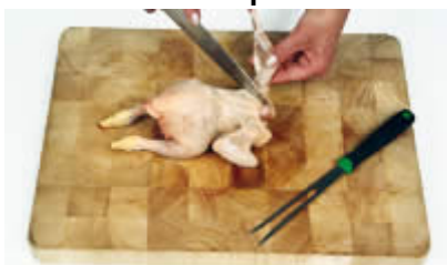
Fase 5: Il taglio delle ali