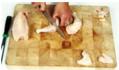
Fase 9: Possiamo anche dividere coscia e sottocoscia