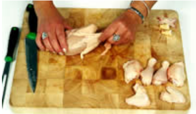
Fase 11: togliamo la pelle dal petto