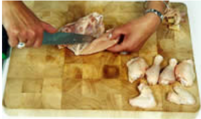
Fase 13: ...aiutandoci con il coltello