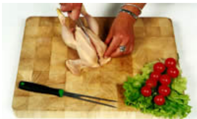
Fase 1: Il taglio del Galletto a metà

Il Galletto può essere cotto intero, aperto, tagliato in 2 o 4 parti, oppure si possono separare filetti, ali e cosce, come illustrato nelle immagini che seguono: