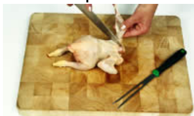
Fase 6: Eliminiamo le estremità