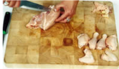
Fase 12: separiamo i filetti...