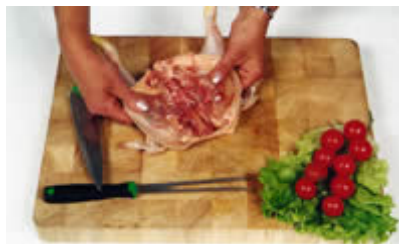
Fase 2: Il Galletto aperto